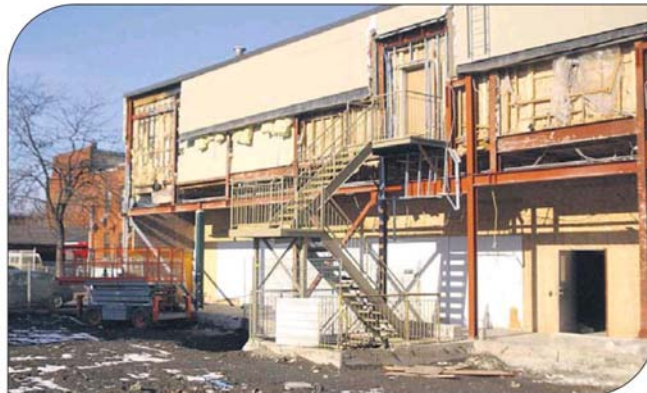
Les travaux sont visibles par l'arrière du bâtiment.