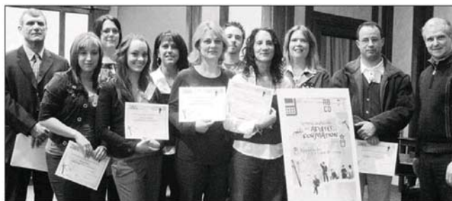
Au total, 86 personnes ont reçu une attestation personnalisée de reconnaissance de la mains des élus lachinois, dans le cadre de la Semaine québécoise des adultes en formation, le 31 mars dernier, à la Mairie de Lachine.

La Semaine québécoise des adultes en formation, c'est aussi l'occasion de reconnaître le courage et la détermination